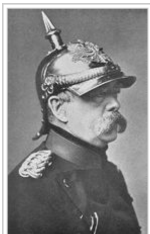
Otto von Bismarck.

Amb bastant anterioritat a 1880, Bismarck i Marx ja es comunicaven mitjançant el sindicalista Ferdinand Lassalle (1825-1864), havent arribat a una comunió d'ideals autopacificants .