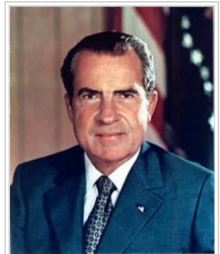
Richard M. Nixon

c. b. c. Tercer període: Segon imperialisme (corrupció total) (des de -2.191). Amb els Gutis, poble del Zagros, invasor de Mesopotàmia, els banquers van implantar la moneda pseudometàl·lica, anònima, no concreta sinó escriptural fiduciària (que va dominar tota l'economia mundial, sota forma d'una mentida institucional, fins a l'agost de 1971, quan Nixon va deslligar el dòlar del patró or, denunciant unilateralment els acords de Bretton Woods de 1944).