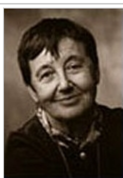
Denise Schmandt-Besserat [1] ( https://webpace.utexas.edu/dsbay/index.html )

En la mesura que el mercat creix, es necessita fer equivalents els intercanvis de mercaderies: la moneda primitiva apareix, doncs, com a unitat abstracta de mesura , que en ésser assignada lliurement, entre dues lliures persones contractants (comprador i venedor) a cada mercaderia elemental dóna en el mercat els preus, els salaris i diner. (Les darreres investigacions sobre l'origen de l'escriptura a l'Àsia Sudoccidental documenten, a partir del 8500 aC, l'existència d' instruments monetaris sense valor intrínsec , que serviren per a mesurar el valor dels intercanvis, especificar les mercaderies i que, progressivament, personalitzaren els agents del mercat. Vegeu « El primer antecedent de l'escriptura », a Investigación y Ciencia número 23, agost 1978, Denise Schmandt-Besserat [2] ( https://webpace.utexas.edu/dsbay/index.html ) ; i número 91, abril 1984, «Números y medidas...», Jöran Friberg.)