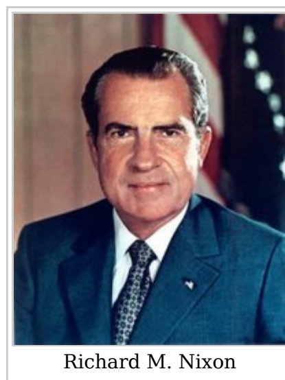
Richard M. Nixon

La moneda, cada cop més, s'està transformant en diner bancari escriptural (anotacions en comptes corrents, darrerament fetes per simples impulsions electròniques), però malgrat haver perdut tot valor intrínsec, continua permetent gran part d'anonimat i desinformació , despersonalització i irresponsabilització de tots els agents del mercat i de la societat.