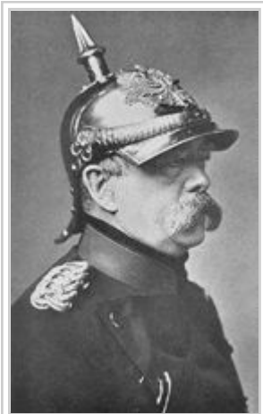
Otto von Bismarck.

Amb bastant anterioritat a 1880, Bismarck i Marx ja es comunicaven mitjançant el sindicalista Ferdinand Lassalle (1825-1864), havent arribat a una comunió d'ideals autopacíficants .