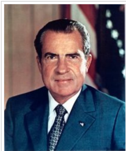
Richard M. Nixon

c. b. b. Segon període: Sargó I i Sargònides. (-2.371/-2.191). Primer imperialisme: redueixen Súmer i tota la Mesopotàmia.