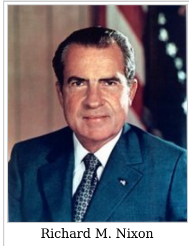
Richard M. Nixon

La moneda, cada cop més, s'està transformant en diner bancari escriptural (anotacions en comptes corrents, darrerament fetes per simples impulsions electròniques), però malgrat haver perdut tot valor intrínsec, continua permetent gran part d'anonimat i desinformació, despersonalització i irresponsabilització de tots els agents del mercat i de la societat.