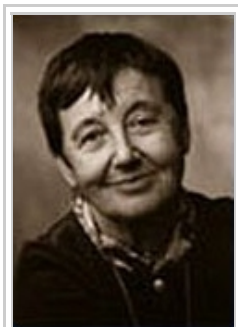
Denise Schmandt- Besserat

En la mesura que el mercat creix, es necessita fer equivalents els intercanvis de mercaderies: la moneda primitiva apareix, doncs, com a unitat abstracta de mesura , que en ésser assignada lliurement, entre dues lliures persones contractants (comprador i venedor) a cada mercaderia elemental dóna en el mercat els preus, els salaris i diner. (Les darreres investigacions sobre l'origen de l'escriptura a l'Àsia Sudoccidental documenten, a partir del 8500 aC, l'existència d' instruments monetaris sense valor intrínsec , que serviren per a mesurar el valor dels intercanvis, especificar les mercaderies i que, progressivament, personalitzaren els agents del mercat. Vegeu « El primer antecedent de l'escriptura », a Investigación y Ciencia número 23, agost 1978, Denise Schmandt-Besserat; i número 91, abril 1984, «Números y medidas...», Jöran Friberg.)