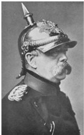
Otto von Bismarck.

Amb bastant anterioritat a 1880, Bismarck i Marx ja es comunicaven mitjançant el sindicalista Ferdinand Lassalle (1825-1864), havent arribat a una comunió d'ideals autopacificants.