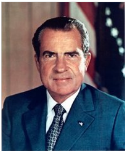
Richard M. Nixon

c. b. b. Segon període: Sargó I i Sargònides. (-2.371/-2.191). Primer imperialisme: redueixen Súmer i tota la Mesopotàmia.