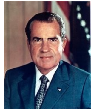
Richard M. Nixon

La moneda, cada cop més, s'està transformant en diner bancari escriptural (anotacions en comptes corrents, darrerament fetes per simples impulsions electròniques), però malgrat haver perdut tot valor intrínsec, continua permetent gran part d' anonimat i desinformació, despersonalització i irresponsabilització de tots els agents del mercat i de la societat.